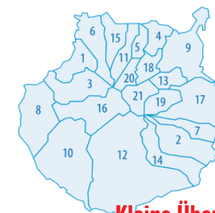
Kleine Übersicht der Orte